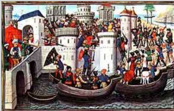
Η κατάληψη της Κωνσταντινούπολης από τους Σταυροφόρους, Παρίσι βιβλιοθήκη Ναυστάθμου

Ένας από τους κορυφαίους Βυζαντινολόγους παγκοσμίως είναι ο Στήβεν Ράνσιμαν. Στο έργο του «Ιστορία των Σταυροφοριών» (Εκδόσεις Γ.Ε.Σ. 1979) στον τρίτο τόμο αναφέρεται